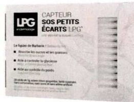
Sticks SOS captura grasas y azúcares, LPG (46 €).

¿Quieres quitar algo de lo que sobra antes del atracón navideño? Aparte de vigilar la dieta, puedes equilibrar una comida trampa con un suplemento dietético que limite la ingesta calórica y la absorción de azúcares.